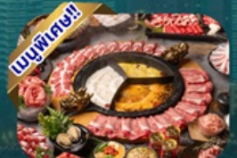
ซูฟไฟ้ชาบู

พักโรงแรม 4 ดาว ★★★★★ ฟรี ประกันอุบัติเหตุ บริการ อาหารท้องถิ่น