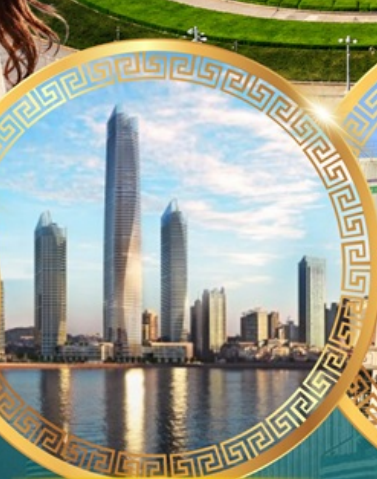
ชมวิวดาคารโซตัน เซ็นเตอร์