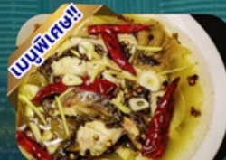
ปลาต้มผักกาดดอง