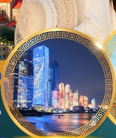
No.3 Bathing Beach

ลานจัดงานเบียร์ชิงเต่า Golden Beach ทางเดินไม้ริมทะเล ศาลเจ้าเทพทะเล ถนนคนเดินโตตง พิพิธภัณฑ์เทศบาลชิงเต่า สวนสาธารณะซิกแนลฮิลล์ ถนนหลงเจียงสู่ กระเช้าภูเขาไท่ผิง ยาน Da Bao island โบสถ์ st.Michael's Cathedral ถนนจงซาน ถนนคนเดินฟ้าย่าน จัตุรัสเมย์ไฟร์