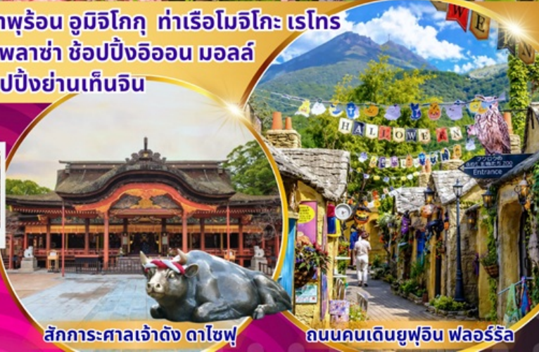
สักการะศาลเจ้าดัง ดาไซฟู