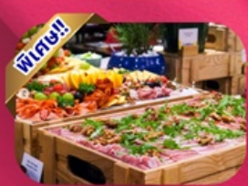
Buffet Dinner Banahill