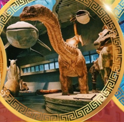
พิพิธภัณฑ์ธรรมชาติเซี่ยงไฮ้