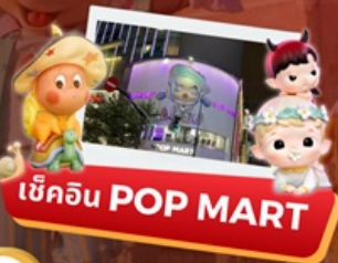
เช็คอิน POP MART