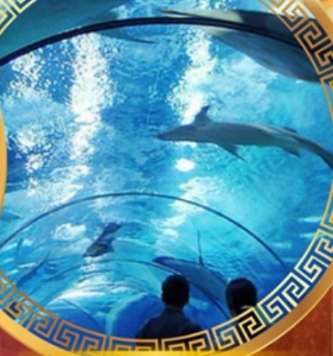
เซี่ยงไฮ้อาเซียนอะควาเรียม