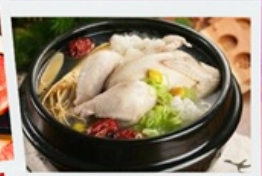
อาหารวังหลวงไก่ตุ๋นโสม