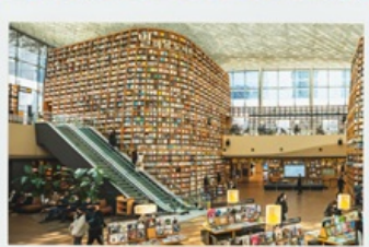
ห้องสมุด สุดชิค