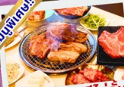
ปิ้งย่างเกาหลีไม่อื่น