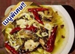
ปลาต้มพริกทอด