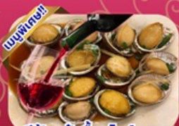
ซีฟู้ด เป้าฮ้อ+ไวน์แดง