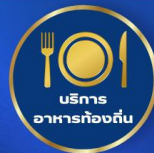
บริการอาหารท้องถิ่น