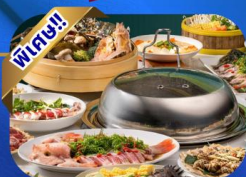
บุฟเฟ่ต์เช้า