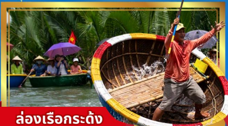
ล่องเรือกระต๊อ