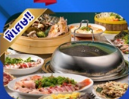
ซูฟไฟต์ชาบู