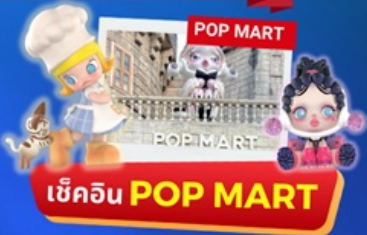
เข้คอิน POP MART