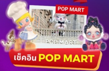
เช็คอิน POP MART