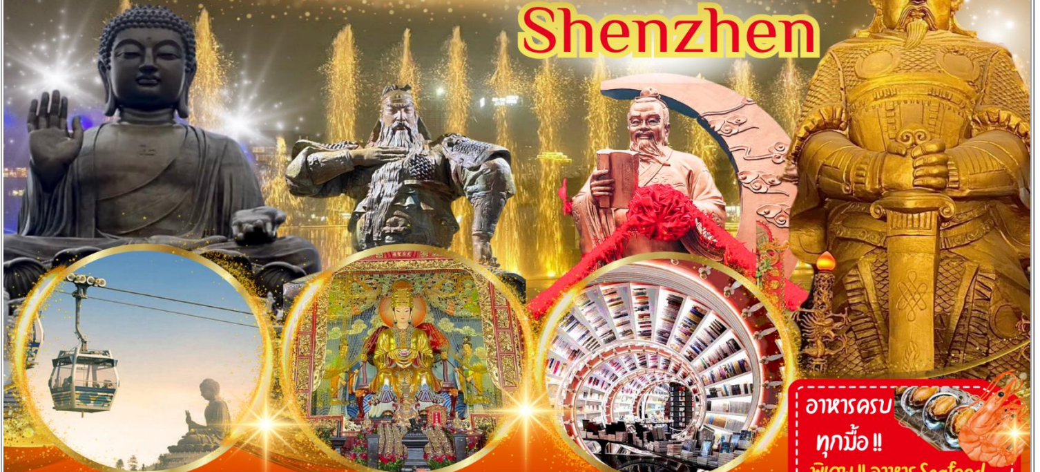
กระเช้าลอยฟ้าองปิง