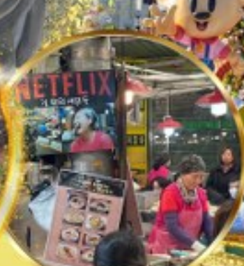
สตรีทฟู้ดตลาดกวางจ็อง