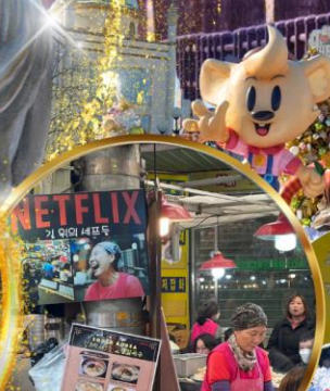
สตรีทฟู้ดตลาดกวางจิ่ง