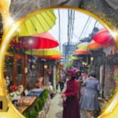
อึ๊กซอนดง