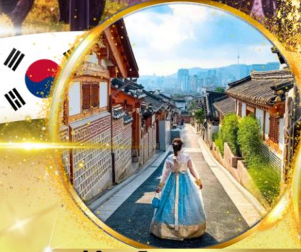
หมู่บ้านโบราณบุกซอน