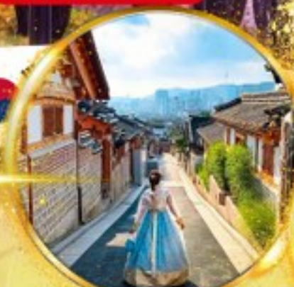
หมู่บ้านโบราณบุกซอน