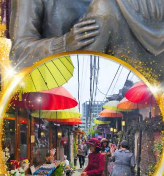
อิกซอนดง