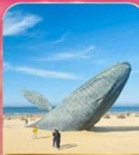
ประติมากรรม "วาฬผู้โดดเดี่ยว"