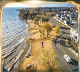
ทะเลสาบเอ่อไห่ โค้งตัว S