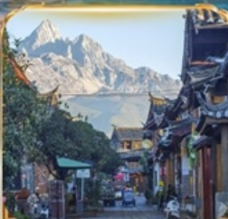
เมืองโบราณซูเหอ