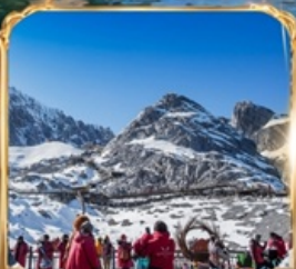
ภูเขาหิมะมังกรหยก +กระเช้าใหญ่