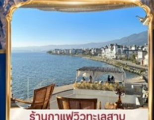
ร้านอาหารวิวทะเลสาบ BAN SHAN YUE (รวมค่าเช่า ไม่รวมเครื่องดื่ม และค่าเช่าเสื้อผ้ารูป)