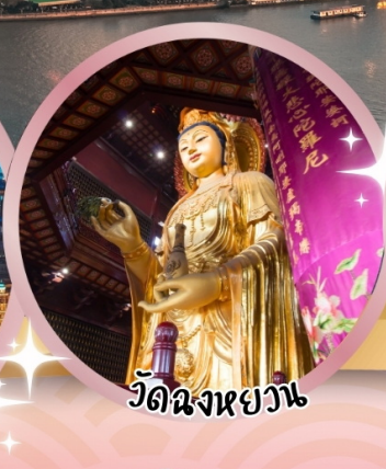
วัดฉงหยวน