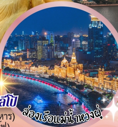
ล่องเรือแม่น้ำหวงผู่