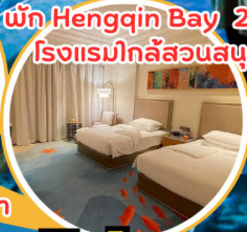
พัก Hengqin Bay 2 คืน!! โรงแรมใกล้สวนสนุก