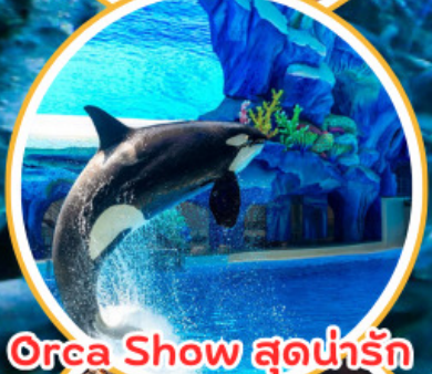
Orea Show สุดน่ารัก