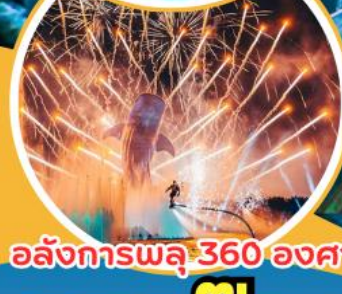
อลังการพลุ 360 องศา