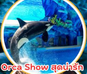
Orca Show สุดน่ารัก