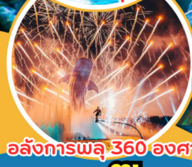
อลังการพลุ 360 องศา