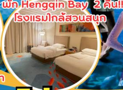
พัก Hengqin Bay 2 คืน!! โรงแรมใกล้สวนสนุก