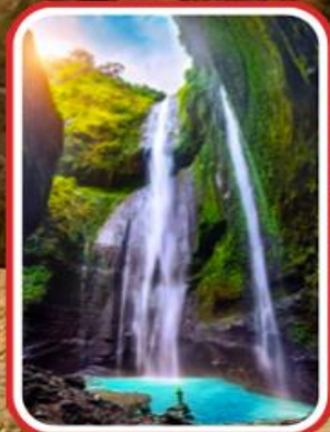
ชมความงดงาม