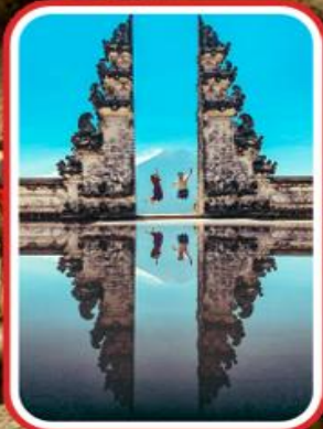
โถงโลกแห่งบาหลี่