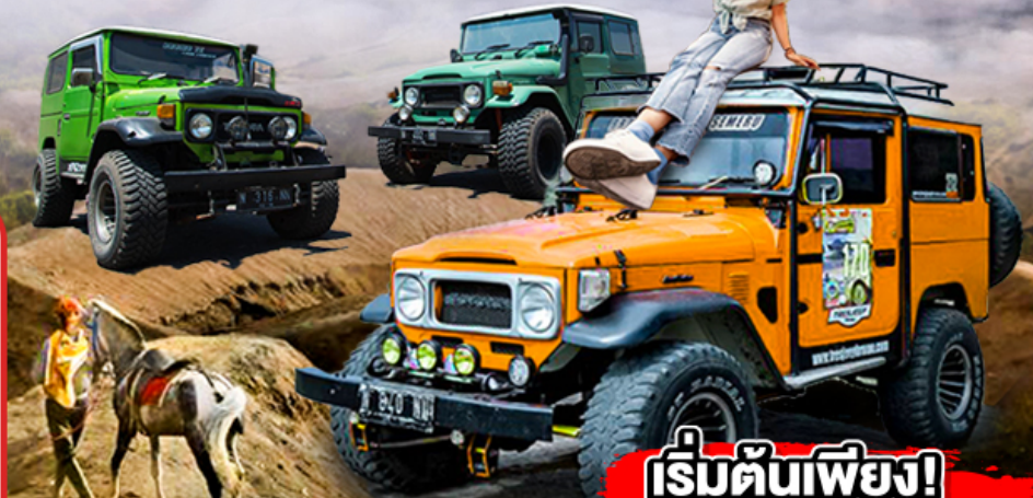
ชมประตูลมปุยปางค์