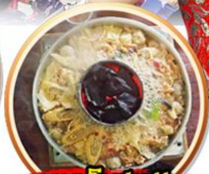
เมนูพิเศษ!! สุกี้เห็ดโตดำ+ปลาเซลมอน