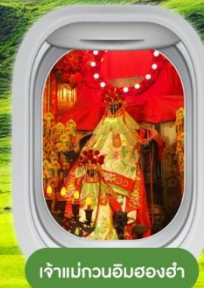
เจ้าม้ากวนอิมฮองฮ่า