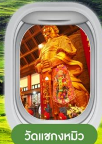
วัดชวงหมิว