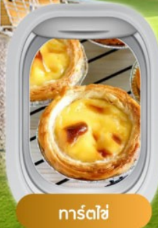
การ์ตไข่