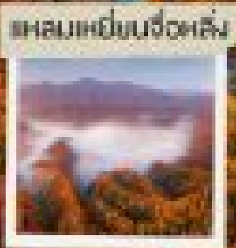
ทะเลหมอกนังฮั่น