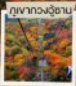
ภูเขาหวงฮ้าน