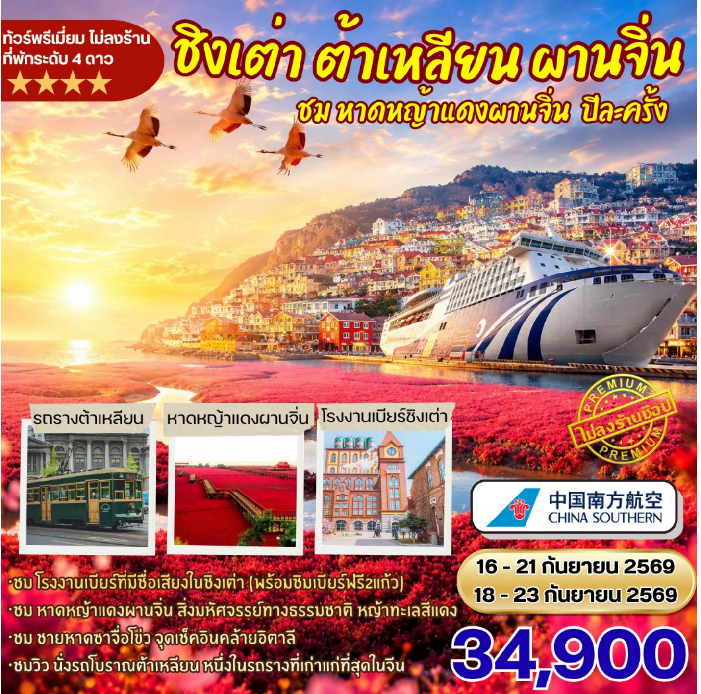
รถรางต้าเหลียน