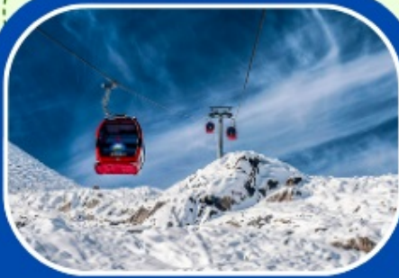
ต่ากู๋ปิงชวน