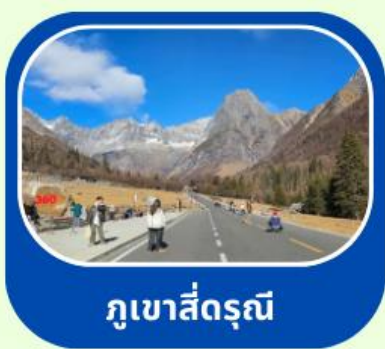
กุเขาสี่ดรุณี