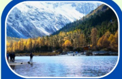
ป่ผิงโกว