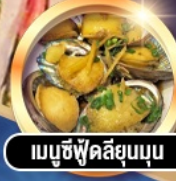
เมนูซีฟู้ดลิ้นยุบนุ่ม