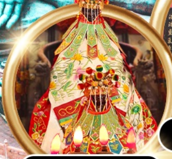
เยี่ยมเงินเจ้าแม่กวนอิมสองอำ