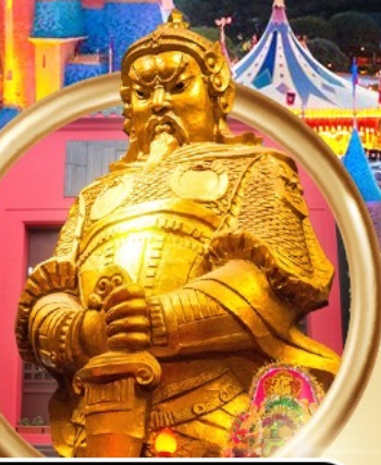
วัดเขกงหนิว