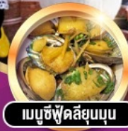
เมนูซีฟู้ดลิ้นมดุน