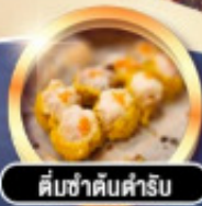
ต้มซ่าดับคำรับ