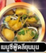
เมนูซีฟู้ดลือลุ่ม