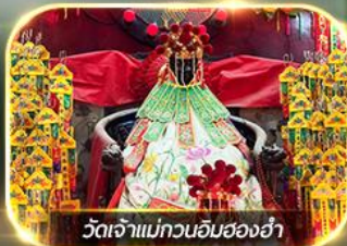
วัดเจ้าแม่กวนอิมสองห้า