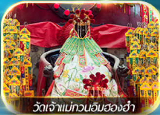
วัดเจ้าแม่ทวนอิมฮ่องกง