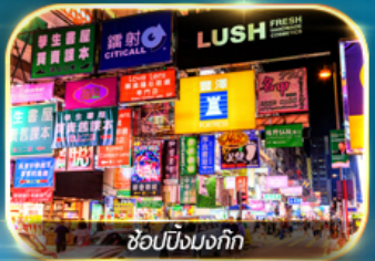
ช้อปปิ้งมอลล์

เต็มอิ่มทั้งบุญ และ ช้อปปิ้งแบบจัดเต็ม จิมซาจุ่ย มงก๊ก