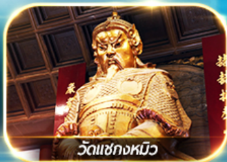
วัดเซ็กกวมิว