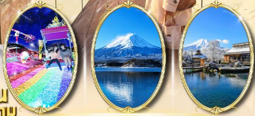
Sagamiko Illumillion Oishi Park Oshino Hakkai