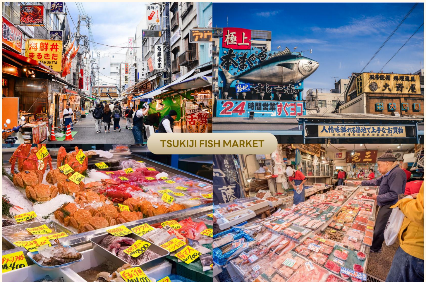
TSUKIJI FISH MARKET

คณะเดินทางถึง สนามบินนานาชาตินาริตะ ประเทศญี่ปุ่น (**เวลาที่ประเทศญี่ปุ่นจะเร็วกว่าประเทศไทย 2 ชม. ควรปรับนาฬิกาของท่านเพื่อสะดวกในการนัดหมาย**) หลังผ่านพิธีตรวจคนเข้าเมืองแล้ว เมืองโตเกียว (Tokyo) มหานครที่ใหญ่ที่สุดแห่งของเอเชีย และของโลก ประกอบด้วยแหล่งท่องเที่ยว แหล่งวัฒนธรรม ศูนย์รวมเศรษฐกิจ เทคโนโลยีทางด้านต่าง ๆ และสถานที่สำคัญทางศาสนา มากมายในมหานครแห่งนี้ที่ผสมผสานกันได้อย่างลงตัว นำท่านเดินทางสู่ ตลาดปลาซึกิจิ (Tsukiji Fish Market) เป็นตลาดที่มีชื่อเสียงมากที่สุดของญี่ปุ่น อีกทั้งยังเป็นที่รู้จักกันดีว่าเป็นหนึ่งในตลาดปลาที่ใหญ่ที่สุดในโลก จากการที่มีการซื้อขายสินค้าทะเลกว่า 2,000 ตันต่อวัน ภายในตลาดแบ่งออกเป็น 2 ส่วนใหญ่ ๆ คือ ส่วนภายนอก ซึ่งมีร้านค้าปลีก ร้านอาหารตั้งเรียงรายเป็นจำนวนมาก และส่วนภายใน ซึ่งเป็นบริเวณที่ร้านค้าส่ง ใช้เจรจาธุรกิจ และเป็นจุดที่มีการประมูลปลาทูบ่าที่มีชื่อเสียง นักท่องเที่ยวส่วนใหญ่มักจะมาเดินช้อปปิ้ง ชิมอาหารสด ๆ ใหม่ ๆ อาทิ แซลมอน อุนิ ปลาไหล ไข่หอยเม่น หอยนางรม รวมไปถึงร้านดังขึ้นชื่อของตลาดนี้อย่างไขหวานม้วน ซึ่งถือเป็นไฮไลท์เด็ดที่ใครมาตลาดนี้ก็ต้องห้ามพลาด