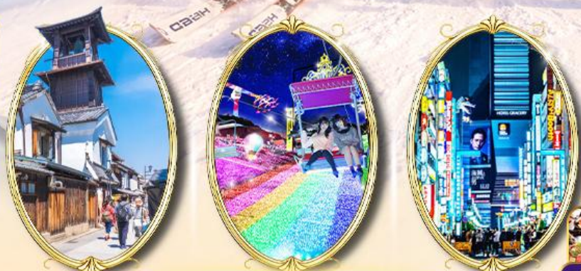
Kawagoe Sagamiko Illumillion Shinjuku

รหัสทัวร์ RJ-TG023 เดินทาง 6D 4N 27 ธ.ค. 69 - 01 ม.ค. 70 31 ธ.ค. 69 - 05 ม.ค. 70