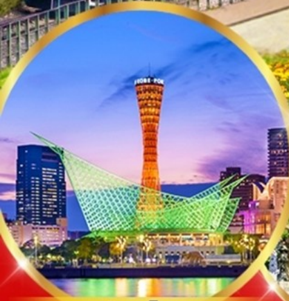
เมืองโกเบ