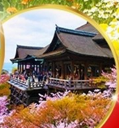
วัดคิโยมิสึ