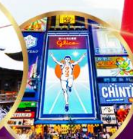
ช้อปปิ้ง ซินโซบาชิ