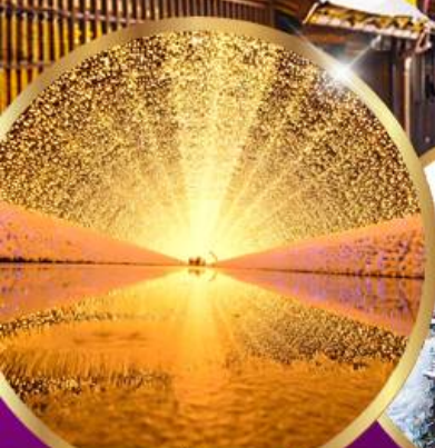
นาบาระ โนะ ซาโตะ