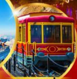
รถรางซาปา