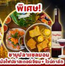
พิเศษ! ซาบูปลาเซลมอน หม้อไฟปลาเซลมอนจีน + ไวน์ดालัด