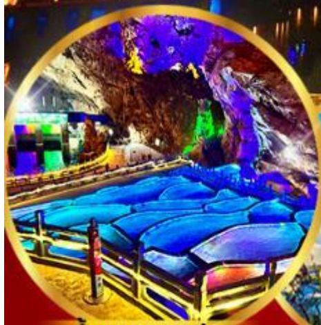
ด่านกนงาแอง