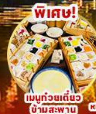
พิเศษ! เมนูถ้วยเดียว ข้ามสะพาน