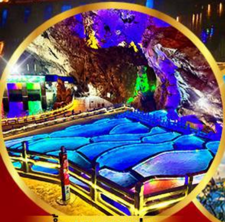
ถ้ำนกนางแอ่น