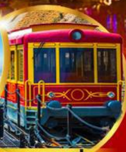
รถรางซาปา