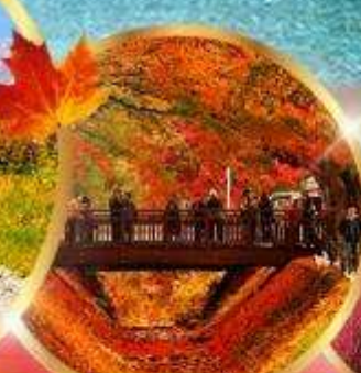
อุโมงค์เมเปิ้ล