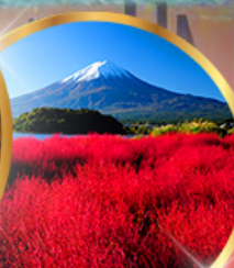
โออิชิ พาร์ค