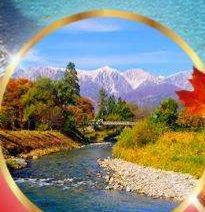
โออิเตะ พาร์ค