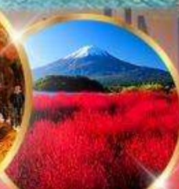
โออิชิ พาร์ค