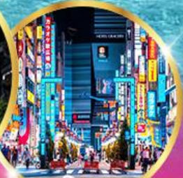
ซัปโปโรชินจูกุ