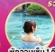
พักผ่อนแช่น้ำ 1 คืน