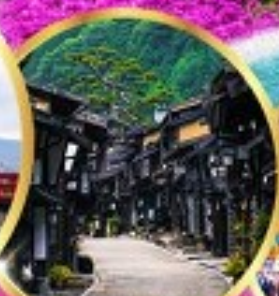
นาราจุกุ