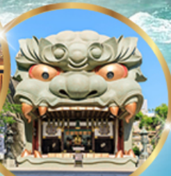
ศาลเจ้านิมะ ยาชากะ