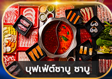
บุฟเฟ่ต์ซาบู ซาบู