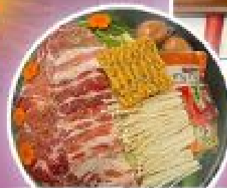
ชาบู ชาบู ฮ่องกง

พิกฮ่องกง 2 คืน พิกใจกลางย่านมงทีก วัดแชกงหมิว เจ้าแม่กวนอิมรพัสเบย์ วัดกวนอู วัดหวังต้าเซียน วัดฮ่องกง วัดเจ้าแม่ทับทิม