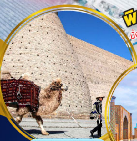
บ้อมปราสาทบุการ์่า