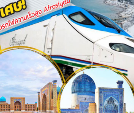
จัตุรัสเรจิสถาน