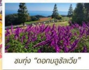
ชมทุ่ง "ดอกบลูซิลเวีย"