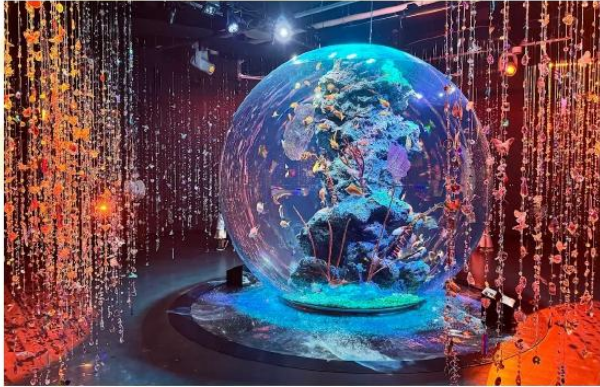
KOBE AQUARIUM ATOA