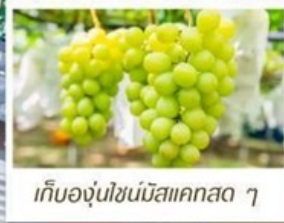
เก็บองุ่นโซนมิสแคสตา ๆ

🇯🇵 เอเชียโทกะ - โอซาก้า (รวมบัตรเข้าสวนสนุก USJ)