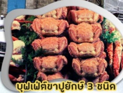
บุฟเฟ่ต์ขาปูยักษ์ 3 ชนิด