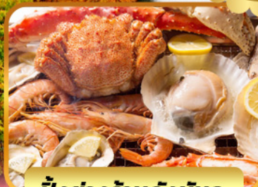
บั้งย่างร้านดังนั้นตะ