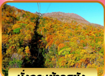
นั่งกระเช้าอุซุซัง