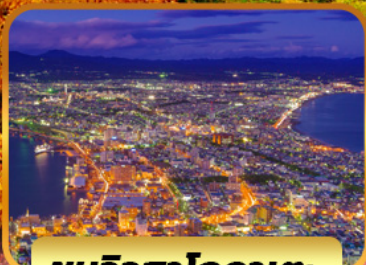
ชมวิวดาโกดาเตะ