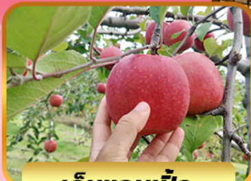
เก็บแอปเปิ้ล