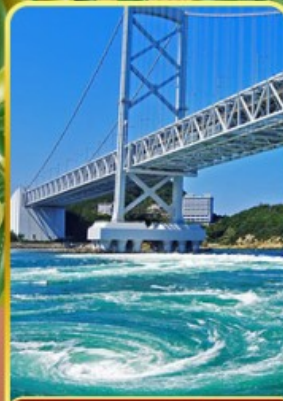
ช่องแคบนารุโตะ