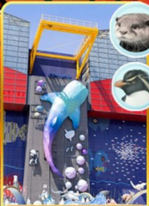
พิพิธภัณฑ์โคยูกิจิ