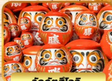
วัดคังสึโอจิ