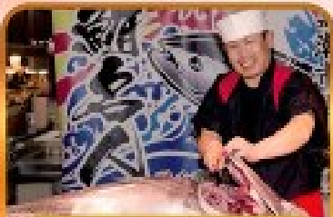
ตลาดปลาคุโรชิโอะ