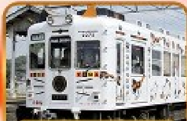
นั่งรถไฟทามะจิง