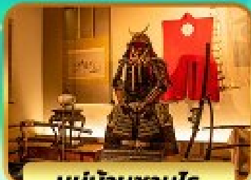
หมู่บ้านซามูไร