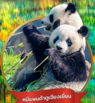
หมีแพนด้ายักษ์เจียงเยี่ยน