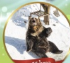
ชมหมีสึน้ำตาล