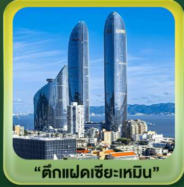
“ตึกแฝดเซี่ยเหมิน”