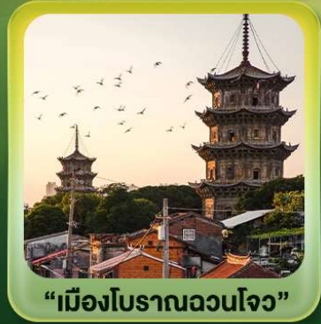
“เมืองโบราณฉวนโจ้ว”