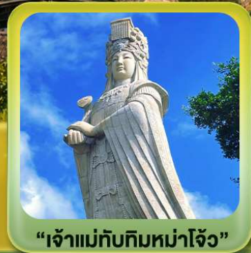
“เจ้าแม่กิมกิมหมาโจ้ว”